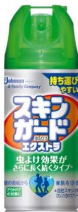
「スキングード エクストラ 105mL」

ジョンソン株式会社(本社:横浜市/社長:鷲津雅広)は、効果が長持ちタイプ ※1 のスキングードエクストラから、外出先やアウトドアに便利な携帯サイズの虫よけ剤「スキングード エクストラ 105mL」を 2016年 4月 11日(月)に発売いたします。